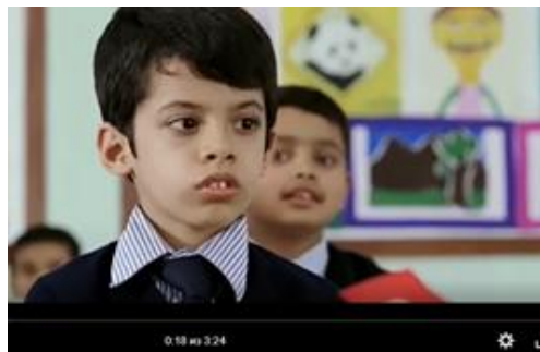
«Звёздочки на земле»