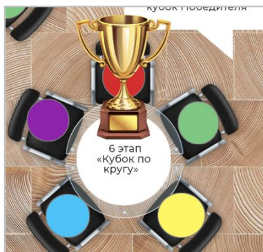
«Кубок по кругу»